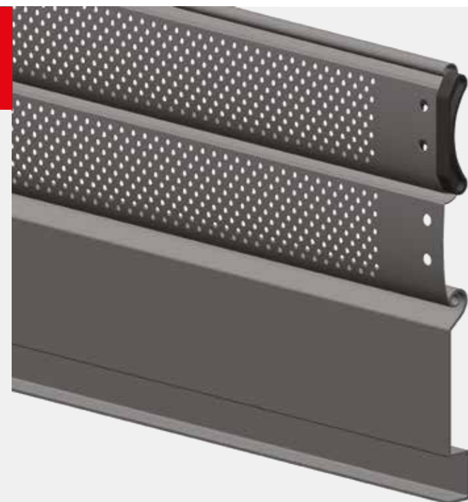
Sabot nylon en option

Le rideau MiniRoll P57 8/10 e RUBIS ISEAVERCOR allie l'esthétisme d'un volet roulant avec son caisson et ses coulisses en aluminium et la sécurité d'un rideau métallique grâce à son tablier en acier 8/10 e .